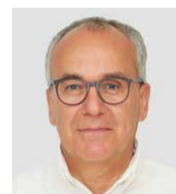
Innenausbau: Kaufmann Oberholzer AG, Pius Zeller

Auch die Innentüren – das sind Stahlzargentüren – die Oblichtverglasungen bei den Innenwänden, die Reduittrennwände, die Garderobeneinbauten sowie die Steigzonenabschlüsse stammen aus der Thurgauer Holzwerkstatt. Sämtliche Innenausbauten passten die Handwerker an die bestehende Gebäudekonstruktion an, denn diese konnte nicht verändert werden.