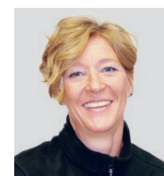
Innenarchitektur: Kaufmann Oberholzer AG, Yvonne Diethelm