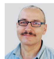
Projektleitung Innenausbau: Kaufmann Oberholzer AG, Albin Böni