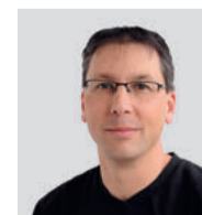
Projektleitung Innenausbau: Kaufmann Oberholzer AG, Thomas Brander

Bauherrschaft: VSG Sulgen Architektur / Bauleitung: Schoch Tavli Architekten, Frauenfeld